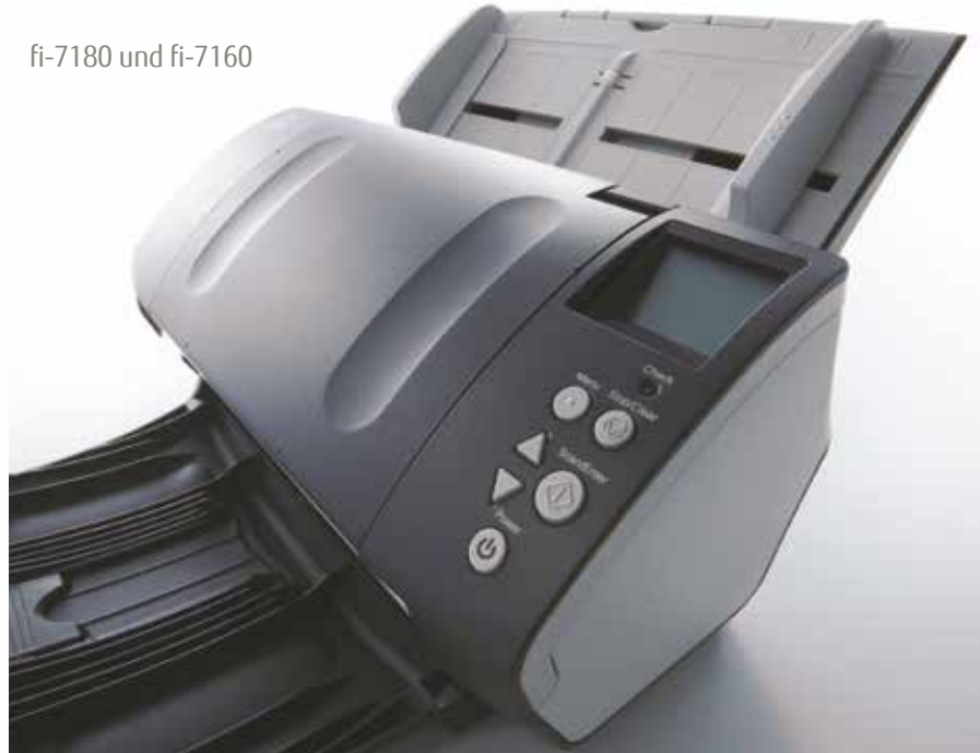
fi-7180 und fi-7160