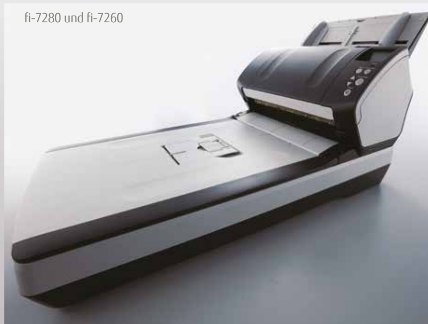
fi-7280 und fi-7260