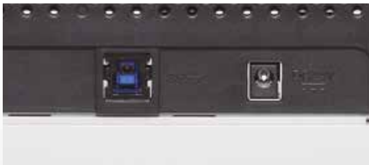
Hohe Geschwindigkeit über USB 3.0 Schnittstelle

Voneinander unabhängige Walzensegmente stellen sicher, dass Schräglagen einzelner Dokumente die Ausrichtung der folgenden Blätter nicht beeinflussen