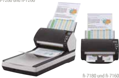
fi-7180 und fi-7160

fi-7160/fi-7260 – (A4-Hoch) bei 300 dpi 60 S./Min. | 120 B./Min. fi-7180/fi-7280 – (A4-Hoch) bei 300 dpi 80 S./Min. | 160 B./Min.